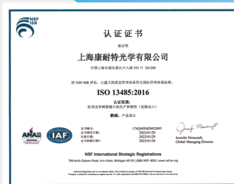
医疗器械质量管理体系认证