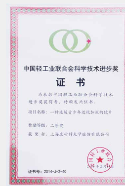
一种延缓青少年近视加深的镜片